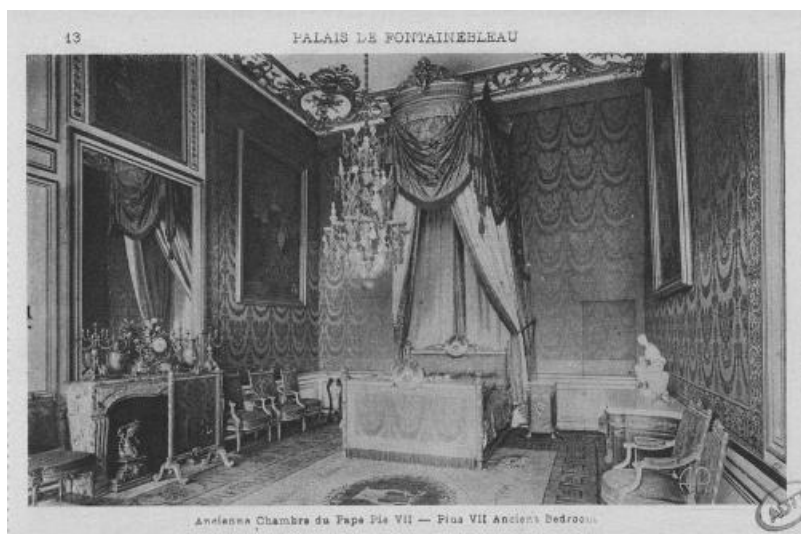
The room of Pope Pius VII, Château de Fontainebleau, photograph, 2Fi9570 ©AD77

Séparé de son entourage et de ses cardinaux enfermés à Vincennes ou exilés en province, Pie VII arrive en juin 1812 à Fontainebleau où il avait déjà été invité en 1804, au terme d'un voyage long et éprouvant. Afin de sauver les apparences, il est traité en hôte et non en captif.